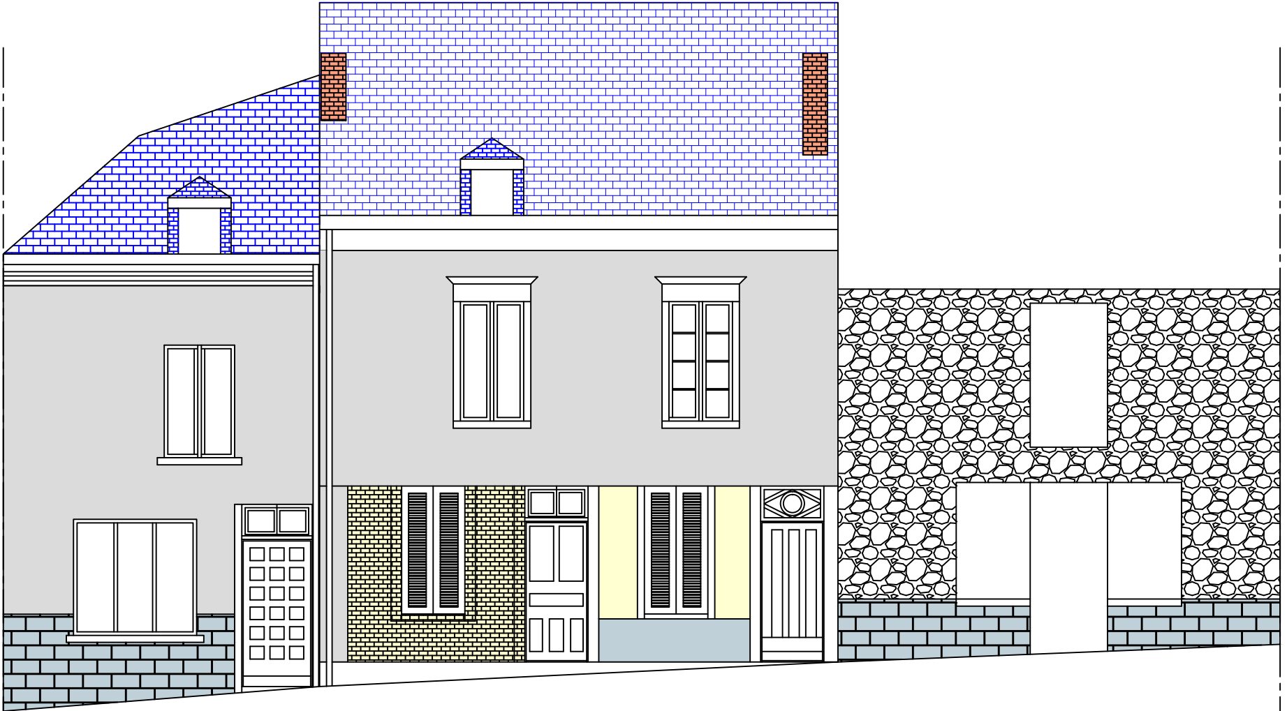
Etat des Lieux - Avant Travaux